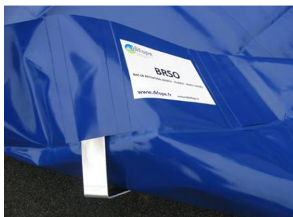
Insertion équerre dans un fourreau