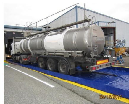
Bac souple 24000 Litres

Nous vous proposons une large gamme standard de bacs de rétention souples pliables de 100 à 80000 litres avec possibilité de fabrication rapide sur mesure . Le bac de rétention souple en PVC constitue un excellent système de stockage temporaire ou permanent de tout produit polluant et répond aux recommandations des DREAL.