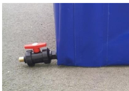
Vanne de vidange (option)