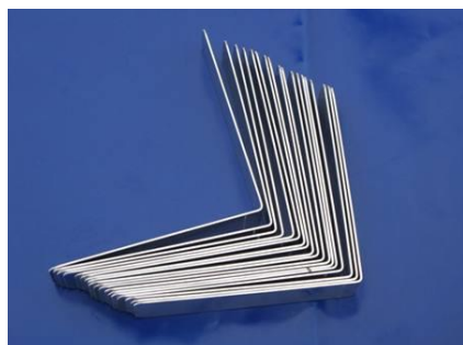
Équerres en aluminium de 3 mm