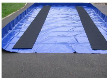
Montage 3 côtés avec bandes de roulement (option) + fermeture