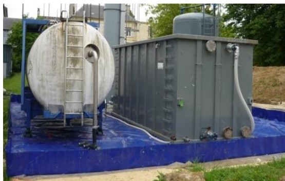
Bac pour matériel dépollution sur chantier