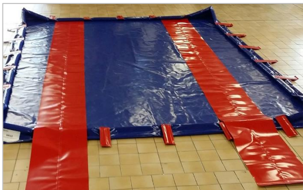
Bandes de protection PVC