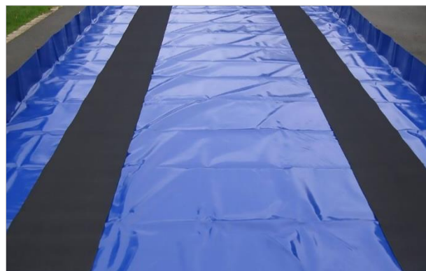
Bandes de protection renforcées caoutchouc