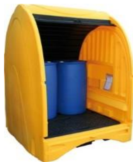
BRP4F EXT- 250