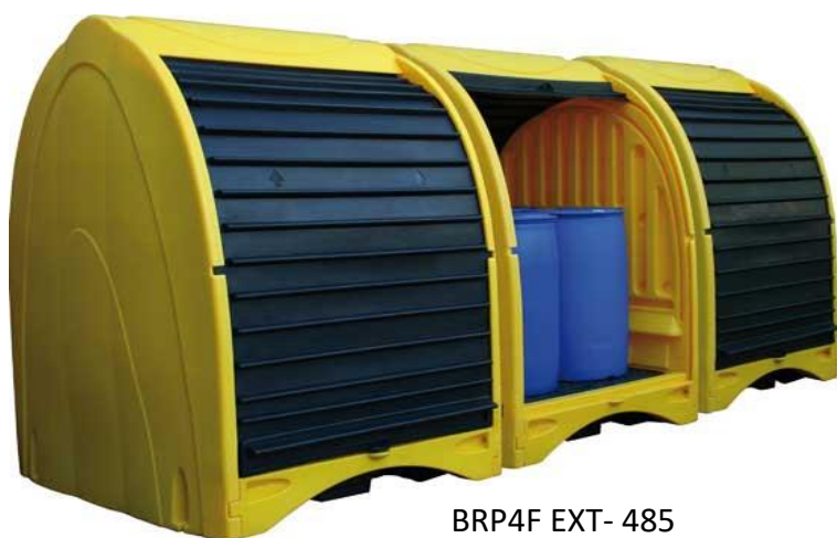
BRP4F EXT- 485