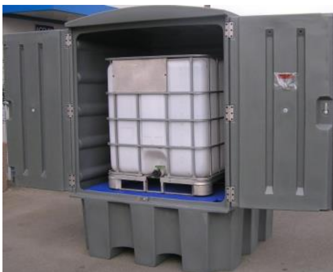
BRP1C EXT 1000