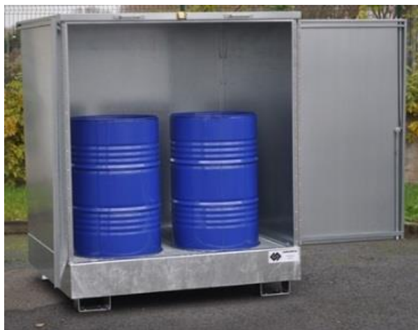
2FCP-VH (2 futs) ou 4FCPH (4 futs)