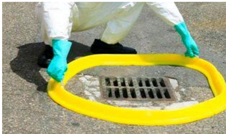
Barrage OBT BP300