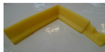
Connecteur d'angle OBT BP300 ANGLE

APPLICATION : Il permet de confiner une pollution et détourner les effluents. Il évite la pénétration des polluants dans les réseaux d'eaux pluviales.