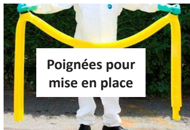
Poignées pour mise en place